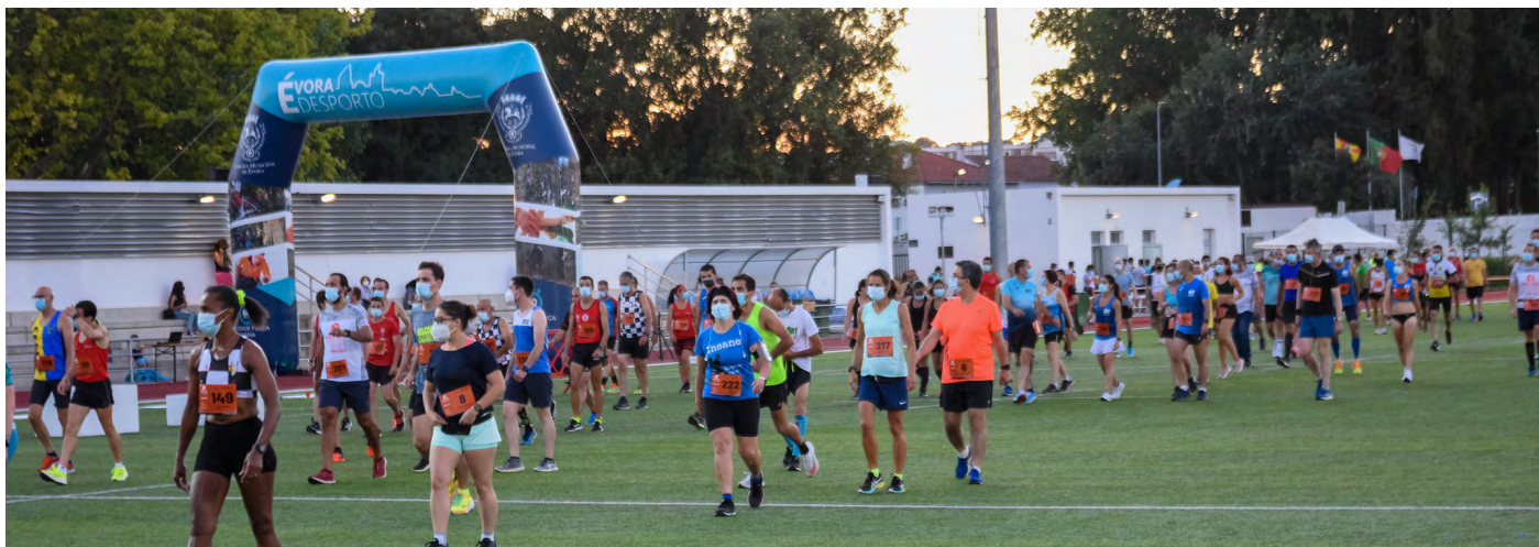
Galeria fotográfica da XXXIX edição do Grande Prémio de São João.