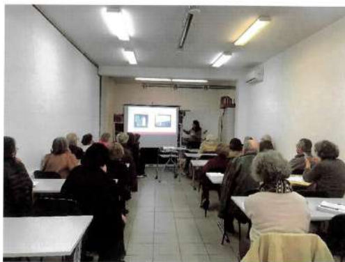
1. Aula da disciplina "À descoberta de Évora"

Quanto à oferta socioeducativa, disponibilizamos um leque de disciplinas, por exemplo: Inglês, Bordados, Cultura e História de Arte, História Geral,