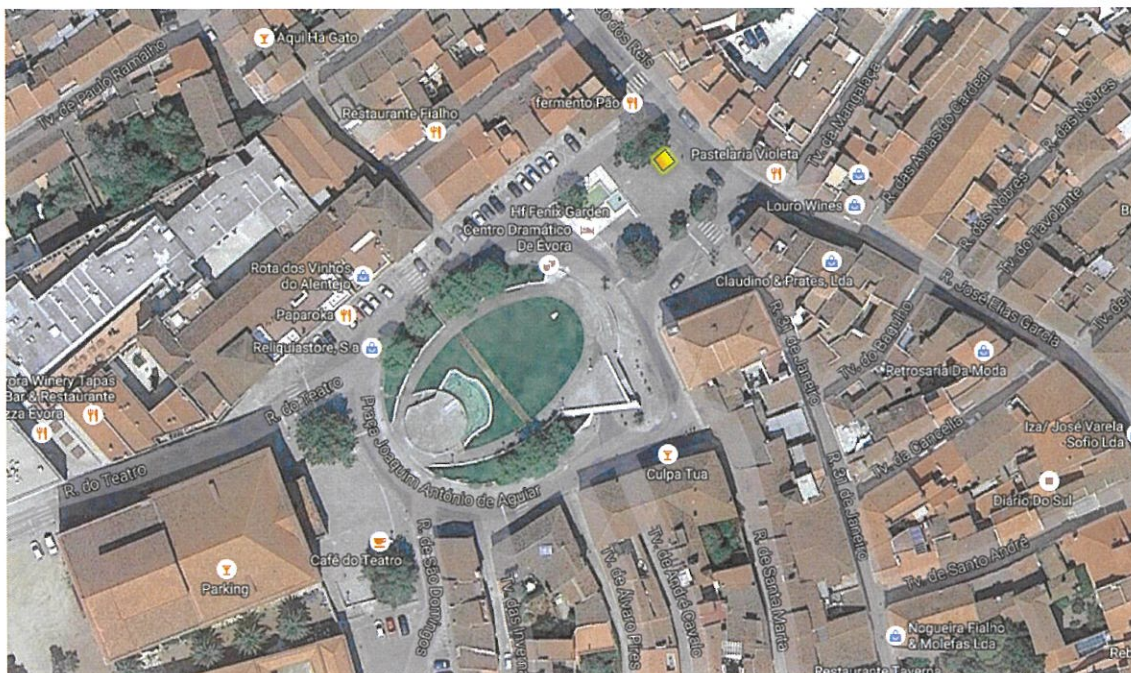
Praça Joaquim António de Aguiar