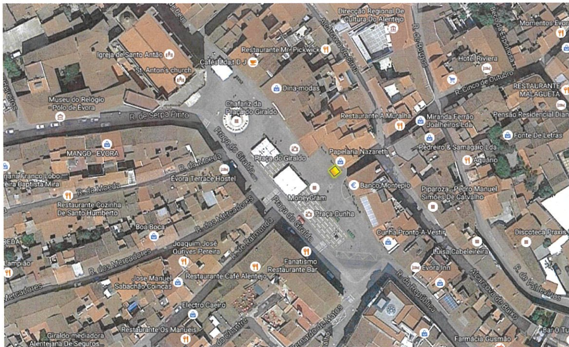
Praça do Giraldo – frente à Rua 5 de outubro (lado Nazareth)