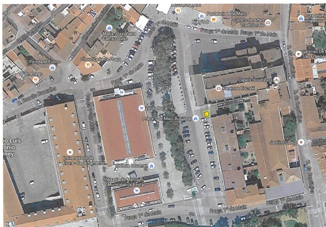
Largo da Igreja de S. Francisco