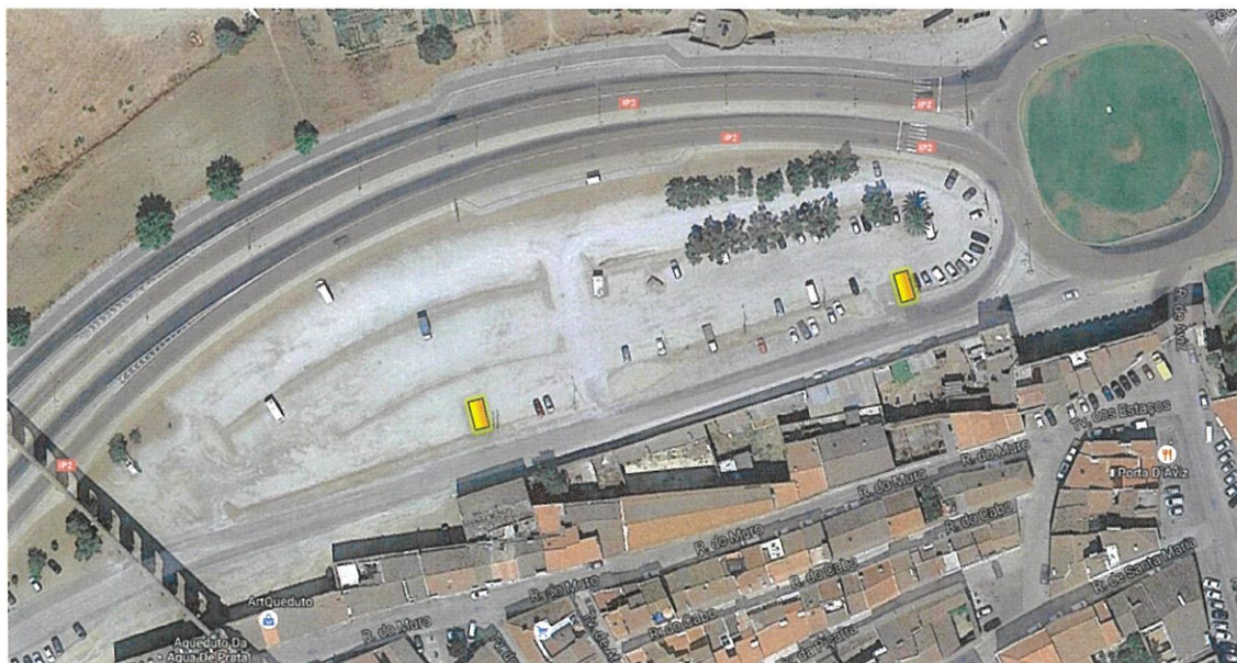
Parque de Estacionamento Portas de Aviz 1 e 2