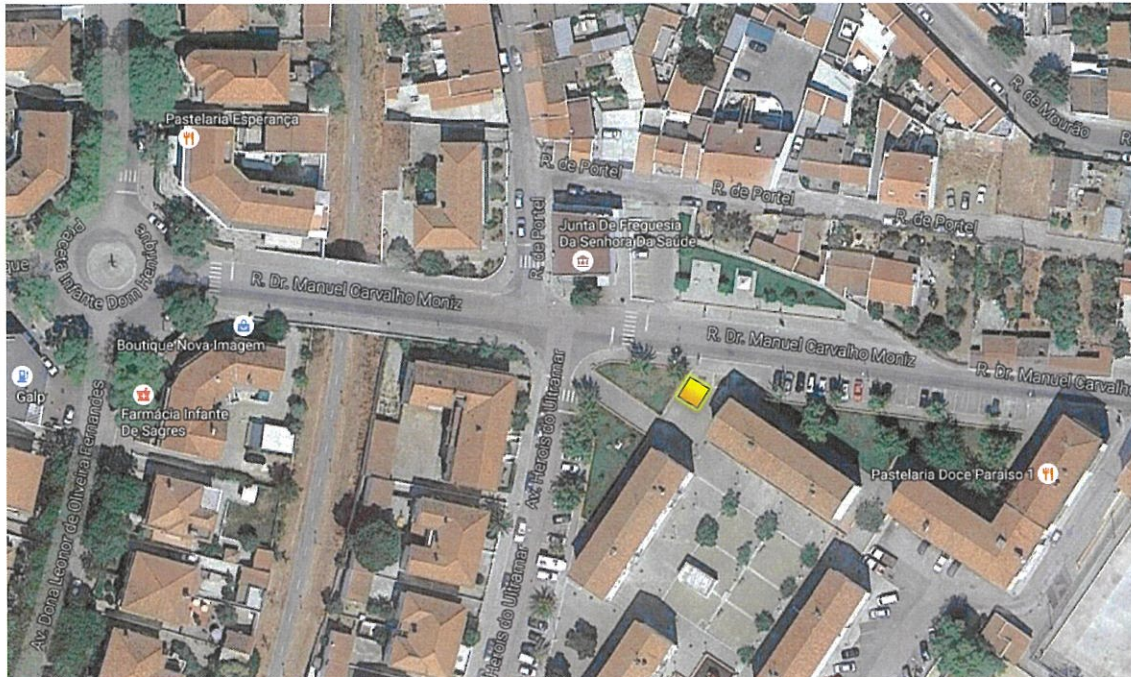
Rua Dr. Manuel Carvalho Moniz junto ao prédio com o n.º 25